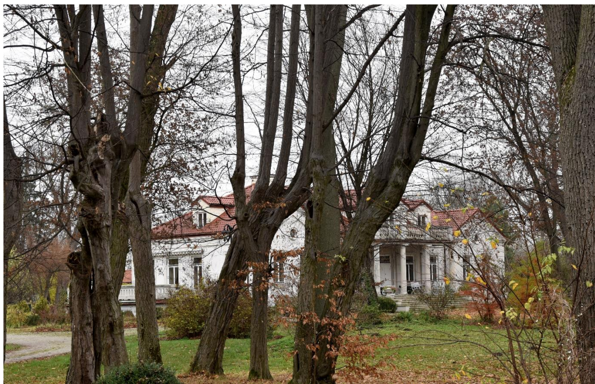
Fot. 5. Strzałków. Dwór.

Park zajmuje powierzchnię ok. 4,5 ha. Kompozycja zespołu dworskiego opierała się na trzech alejach. Obecnie zachowały się dwie: brzozowa (północna część parku) i grabowa (południowo-zachodnia). Aleja dojazdowa - grabowa, przy drodze do dworu straciła swój pierwotny charakter przez częściowe wycięcie drzew i zmianę przebiegu drogi. Ale brzozowa dobrze zachowana. W części północnej parku znajdują się stawy. Drzewostan mieszany. Park wpisany jest do rejestru zabytków pod nr 762.