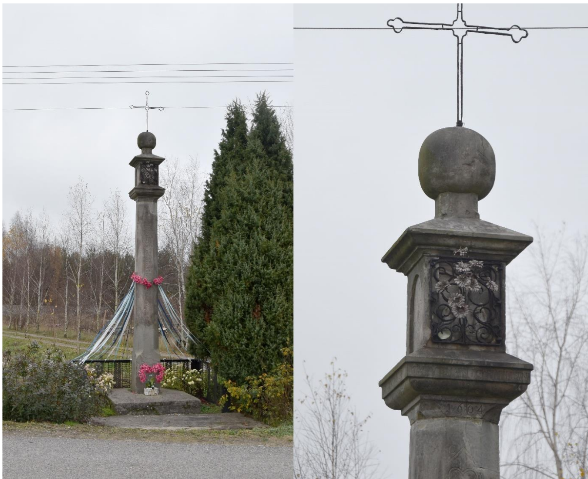
Fot. 8. Mniszek. Kapliczka z 1604 r..