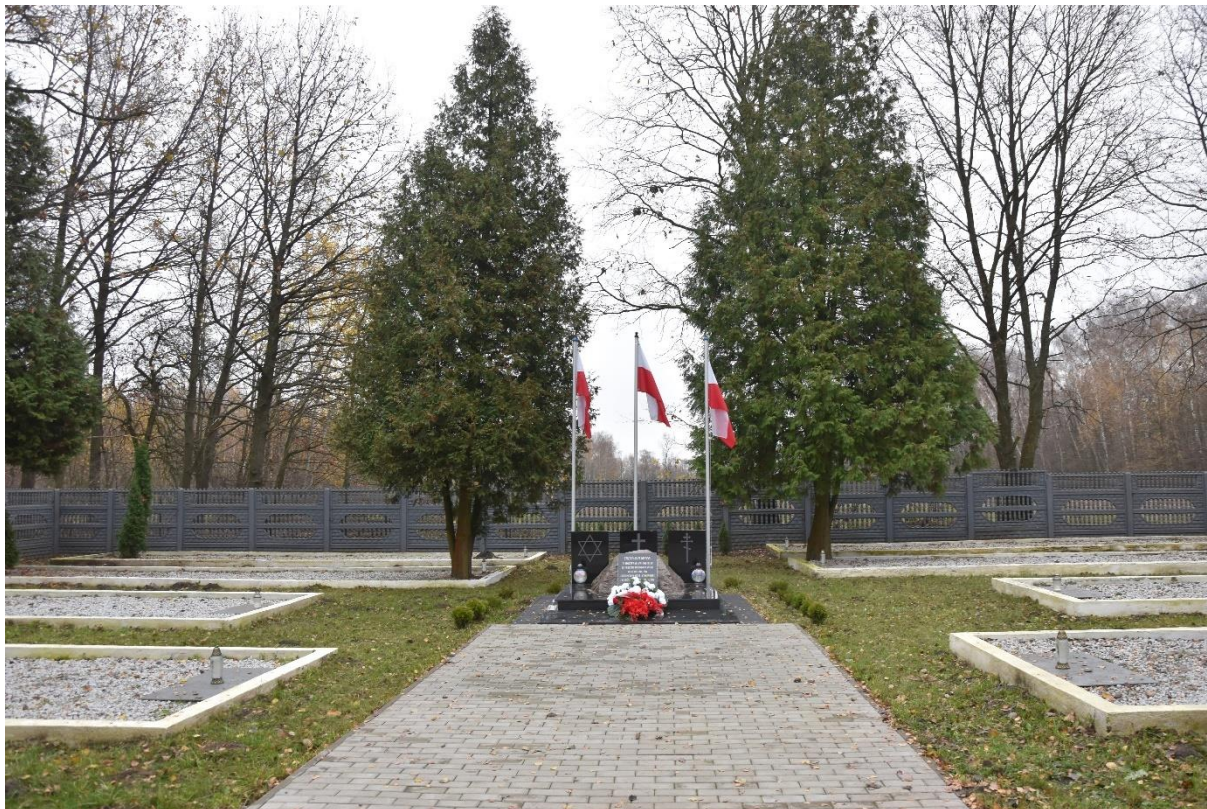
Fot. 3. Chruslice. Cmentarz wojenny (fot. autor opracowania).

Cmentarz żydowski w Wolanowie. Zlokalizowany na pd. - zach. od centrum miejscowości, przy ul. Spacerowej. Dokładna data założenia cmentarza nie jest znana. Z całą pewnością istniał w latach 80-tych XVIII w. Wiadomo, że w okresie międzywojennym był ogrodzony. Obiekt uległ daleko posuniętym zniszczeniom podczas II wojny światowej oraz w latach późniejszych. Ostatni nagrobek w obrębie cmentarza znajdował się na początku lat 90. XX w.