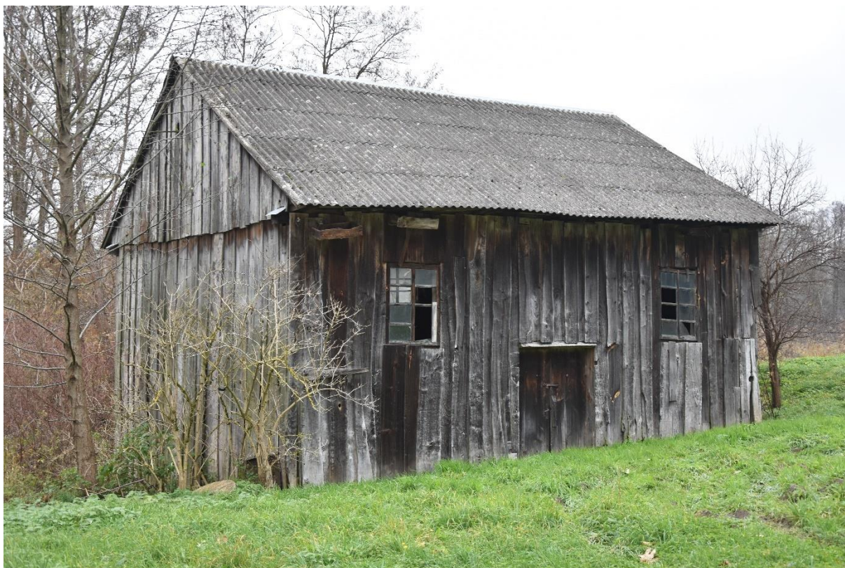
Fot. 7. Zabłocie. Młyn.

Szalowany pionowymi deskami. Elewacja frontowa 3-osiowa z dwoma otworami okiennymi i wejściem na osi. Dach dwuspadowy, kryty eternitem.