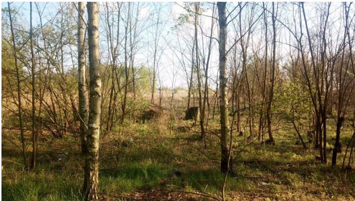
Fot. 4. Wolanów. Cmentarz żydowski.